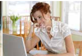
En línea desde el hogar