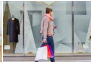
Lugar de negocios